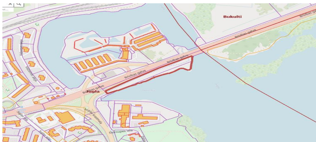
8.6. Strazdupītes tiltiņš. Rīgas Vidzemes priekšpilsēta, Jugla. Kadastra Nr. 01000922236.

*ŠIS DOKUMENTS IR PARAKSTĪTS AR DROŠU ELKETRONISKO PARAKSTU, KAS SATUR LAIKA ZĪMOGU