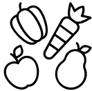
Augļi, dārzeņi, rieksti