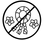
Floristikas izstrādājumi, mākslīgie ziedi