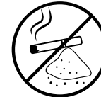
Pelni, ogles, izsmēķi