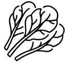
Augi, to saknes, laksti, lapas