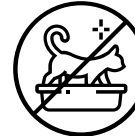
Mājdzīvnieku pakaiši, izkārnījumi