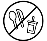
Vienreizlietojamie trauki, galda piederumi