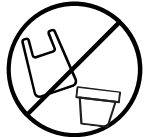
Plastmasas un BIO maisīņi, plēves, puķu podi