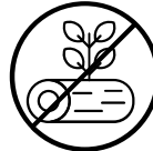
Resni zari, celmi, koksne